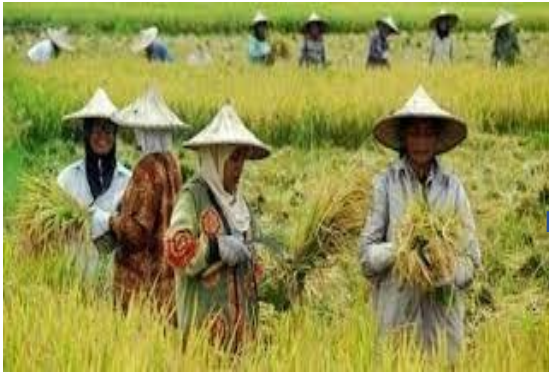
Gambar 4 Masyarakat mengetam padi