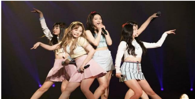
Gambar 3 Pengaruh budaya lain Sumber: https://www.quireta.com , 21 Mei 2021, 10.32 WITA

1) Menurut pendapat kalian apa keterkaitan gambar-gambar di atas dengan materi Perubahan Sosial teristimewa dalam memahami dan mengidentifikasi faktor-faktor penyebab perubahan sosial dalam masyarakat?