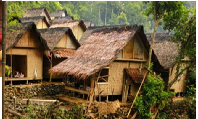
Gambar 8 Kampung yang terisolir Sumber: https://belajarbahasa.github.io , 21 Mei 2021, 06.47 WITA