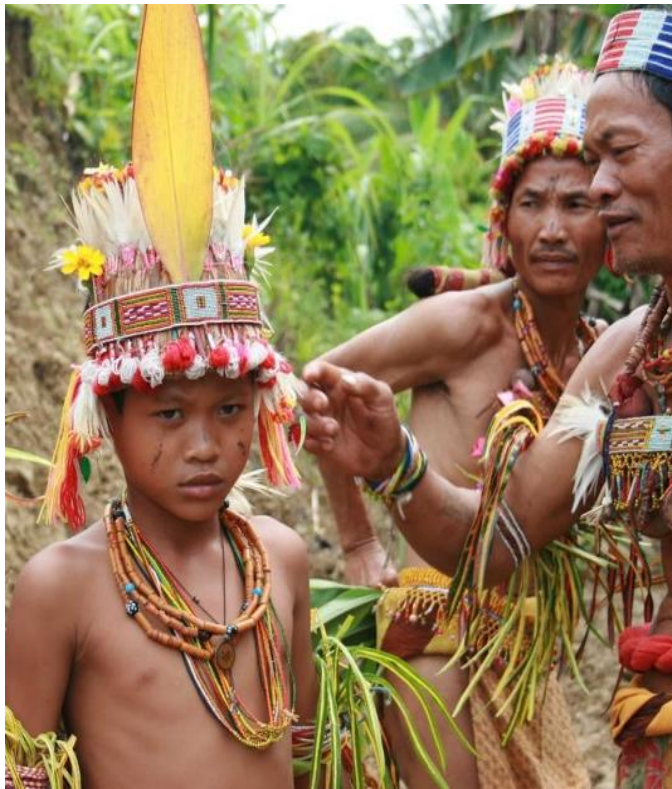
Gambar 6 Adat istiadat yang kuat