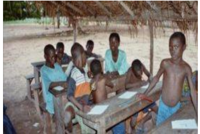
Gambar 7 Pendidikan belum maju Sumber: http://www.african-union.org , 21 Mei 2021, 06.46 WITA