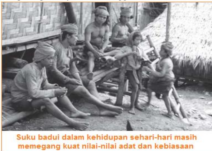
Suku badui dalam kehidupan sehari-hari masih memegang kuat nilai-nilai adat dan kebiasaan