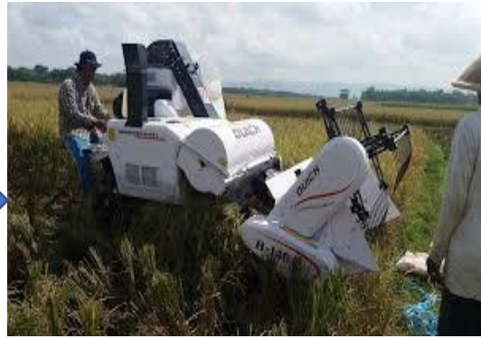
Gambar 5 Alat teknologi mengetam padi Sumber: https://www.google.com . 20 Mei 2021, 11.15 WITA