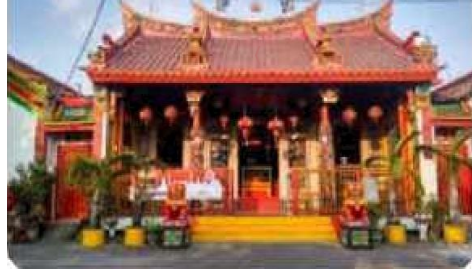
KELENTENG Tempat ibadah umat Kong Hu Cu