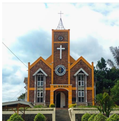
GEREJA Tempat ibadah umat Kristen dan Katholik