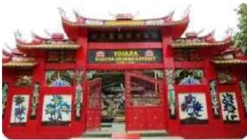
VIHARA Tempat ibadah Budha