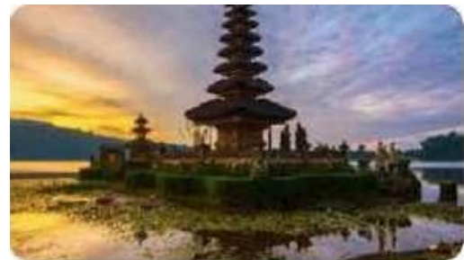
PURA Tempat ibadah Hindu