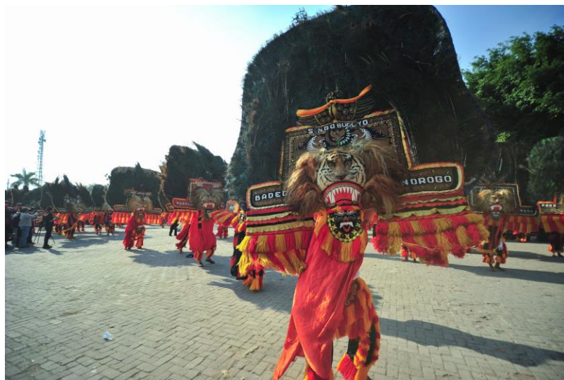
Reog Ponorogo, Ponorogo, Jawa Timur