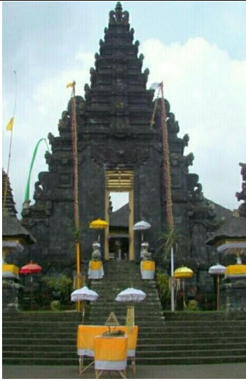
Rumah ibadah Hindu