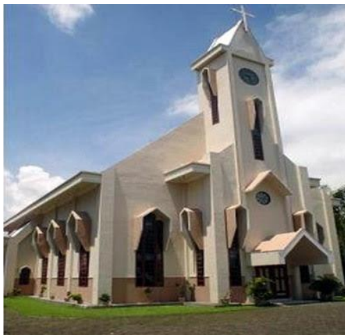
Gereja Protestan – Tempat ibadah Umat kristen Protestan