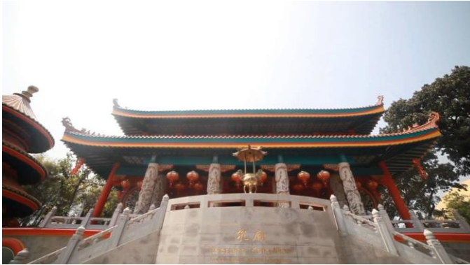
Rumah ibadah Kongucu