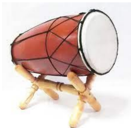
Alat musik gendang