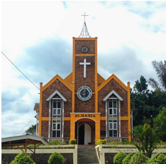
Gereja Khatolik – Tempat ibadah umat kristen Khatolik