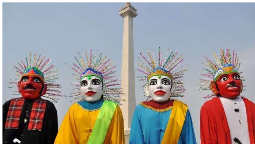
Kesenian Khas Masyarakat Betawi