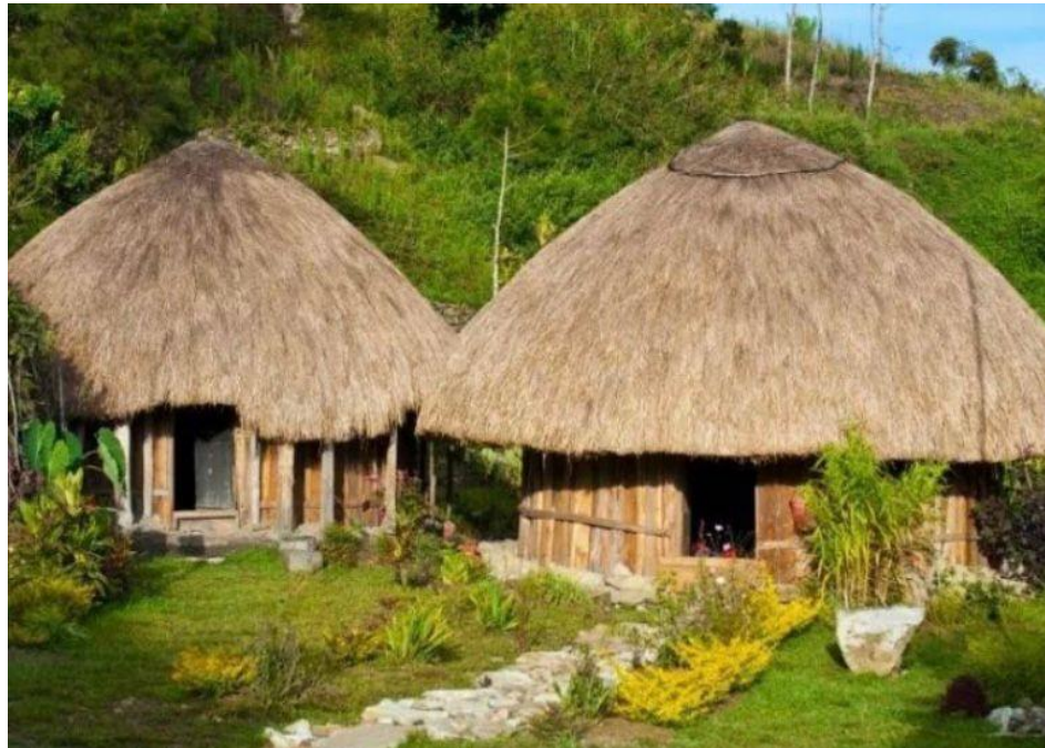
PAPUA- Rumah Adat HONAI