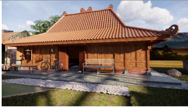
1. Jawa Tengah : Rumah Joglo