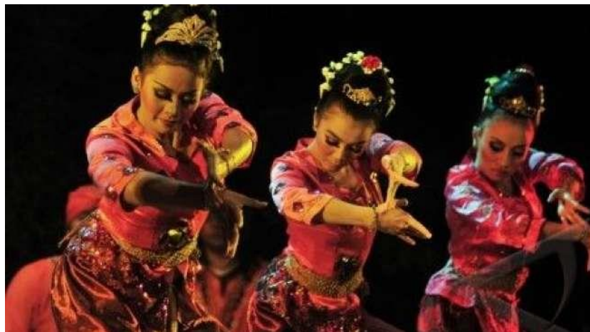
Tari Jaipong - Tarian Jawa Barat