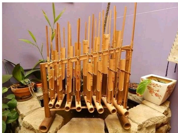
Angklung – jawa Barat