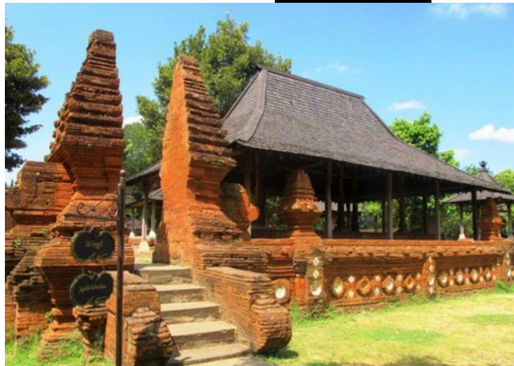
Jawa Barat : Rumah Kasepuhan