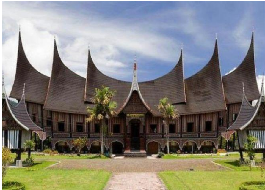
Sumatera Barat : Rumah Gadang