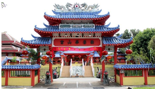
Klenteng – Rumah ibadah Umat Budha