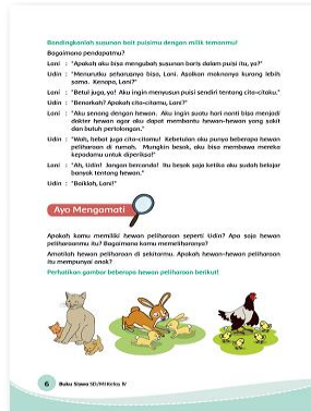
Sumber buku Tema 6 buku Siswa

1. Peserta didik mengamati beberapa gambar hewan peliharaan, peserta didik mengamati gambar anak hewan dan hewan yang sudah dewasa. Dengan bimbingan guru, peserta didik lalu mendiskusikan bagaimana hewan-hewan tersebut mengalami pertumbuhan.