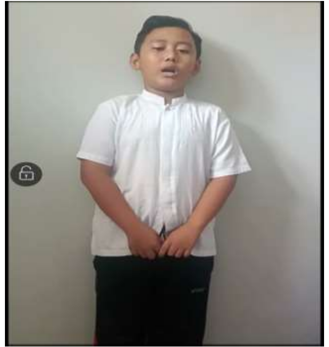
Proses penilaian keterampilan siswa membaca pantun dan menyanyikan lagu tangga nada mayor atau minor