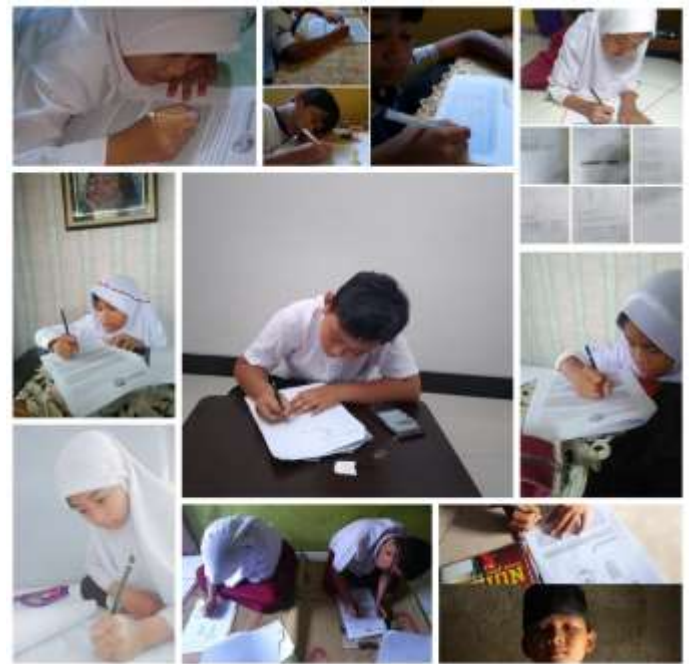
Kegiatan asinkron saat siswa mengerjakan LKPD