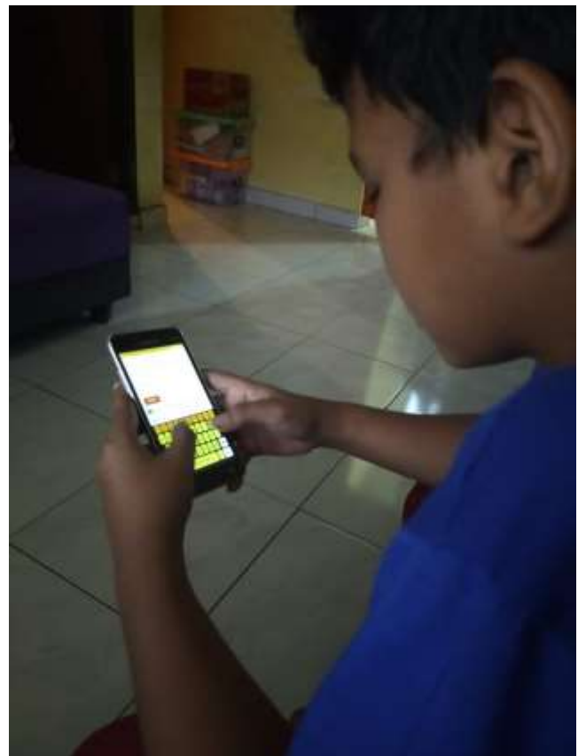
Pelaksanaan evaluasi melalui aplikasi google form