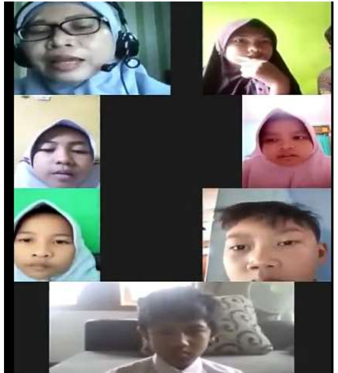
Kegiatan menyimpulkan materi pelajaran hari ini dan penutup