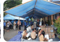
Mengumpulkan bantuan untuk korban bencana alam