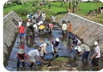
Kerja bakti membersihkan sungai