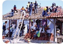
Gotong royong membangun rumah