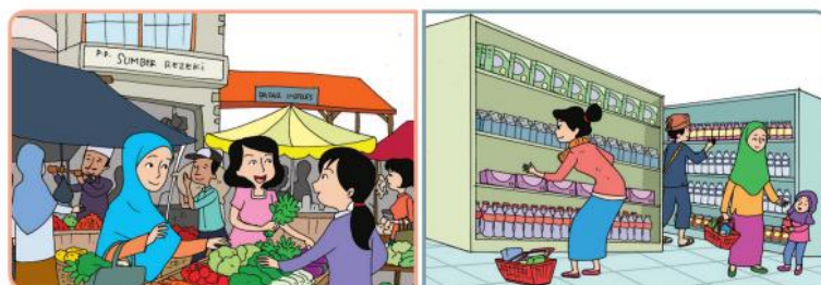
Kegiatan jual beli di pasar

Perdagangan adalah semua hal yang berhubungan dengan kegiatan jual beli. Dalam perdagangan ada perpindahan hak milik. Pedagang membeli barang atau jasa dari suatu tempat pada waktu tertentu, kemudian menjualnya ke tempat lain dengan tujuan memperoleh keuntungan. Tanpa adanya perdagangan, setiap orang harus memproduksi sendiri segala kebutuhan hidupnya. Dengan adanya perdagangan, produsen menjual hasil produksinya pada konsumen. Barang-barang yang diperdagangkan antara lain bahan makanan, pakaian, hewan, barang elektronika, kendaraan bermotor, dan sebagainya.