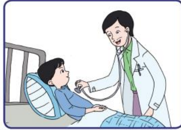
Dokter memeriksa pasien

Jasa adalah segala aktivitas atau manfaat yang ditawarkan kepada orang lain (konsumen). Meskipun tidak menghasilkan barang seperti misalnya industri konfeksi menghasilkan pakaian. Usaha jasa memberikan pelayanan kepada konsumen. Contoh pekerjaan yang menjual jasa adalah guru, pengacara, dokter, montir mobil, jasa keuangan, pemandu wisata, dan sebagainya.