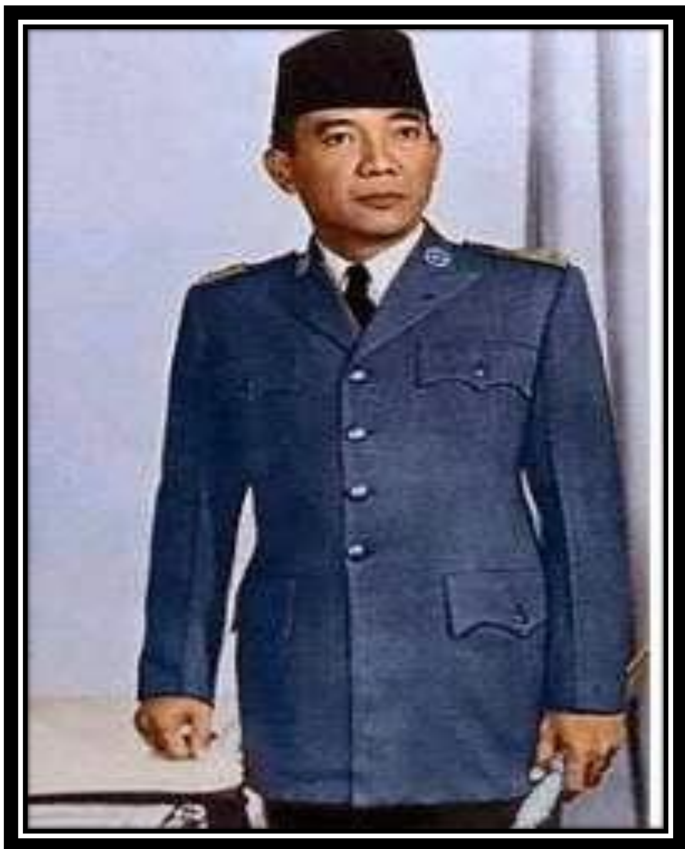
Media 1: Gambar Ir. Soekarno