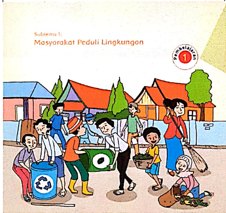
Subtema 1: Masyarakat Peduli Lingkungan

Kegiatan ini dimaksudkan sebagai pra-test dan merangsang keingintahuan siswa untuk belajar tentang peduli lingkungan. Dengan demikian, kegiatan awal pembelajaran ini dilakukan secara menarik dan interaktif.