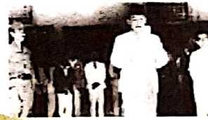
Soekarno membacakan Proklamasi Kemerdekaan Indonesia pada tanggal 17 Agustus 1945.

Setiap bangsa pasti menginginkan kemerdekaan karena kemerdekaan merupakan cita-cita dan tujuan yang ingin dicapai. Begitu juga dengan bangsa Indonesia. Bangsa Indonesia pernah mengalami masa penjajahan cukup lama dan membuat rakyatnya menderita. Karena alasan itulah bangsa Indonesia bekerja sama, bahu membahu dengan sekuat tenaga berjuang untuk memperoleh kemerdekaannya.