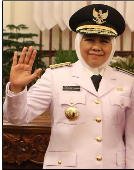
Gubernur Jawa Timur