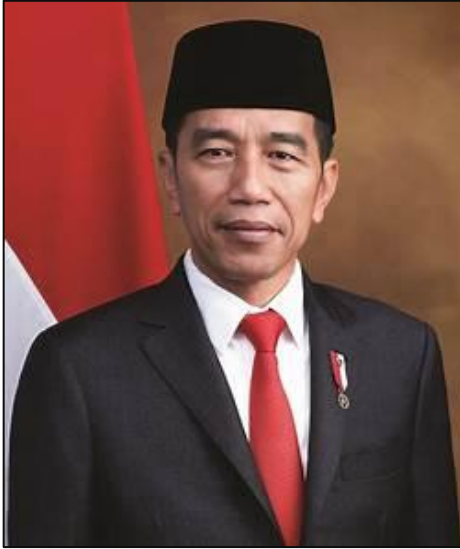
Presiden Republik Indonesia