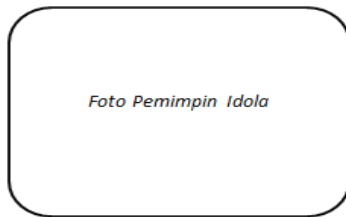
Foto Pemimpin Idola