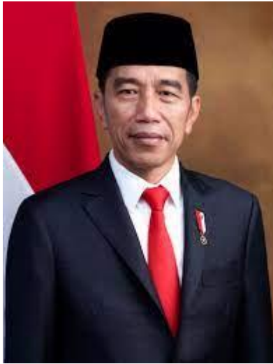
Ir. H. Joko Widodo Presiden RI ke-7