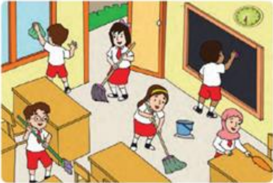
Lampiran 2 Gambar Pendukung