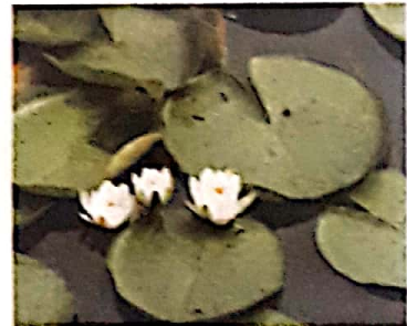
Subtema 1: Rukun dalam Perbedaan 1