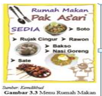
Sumber: Kemdikbud Gambar 3.3 Menu Rumah Makan