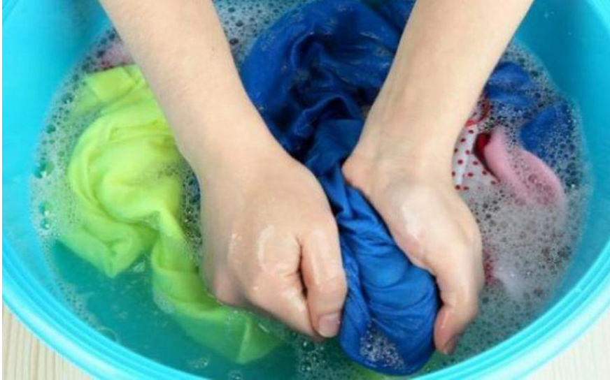
Contoh : Manfaat air untuk manusia memenuhi keperluan rumah tangga (mencuci)