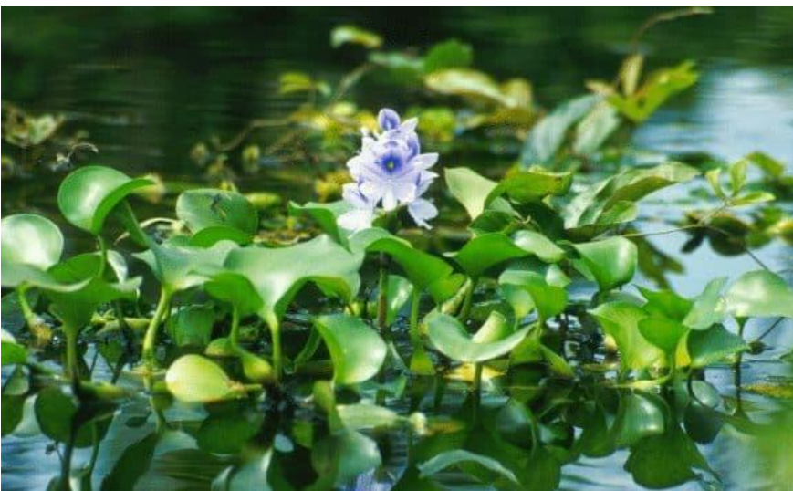
Contoh : Manfaat air untuk tempat tumbuhan hidup