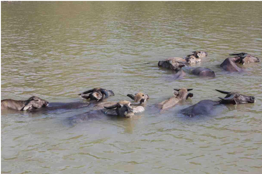
Contoh : Manfaat air untuk hewan membersihkan tubuhnya