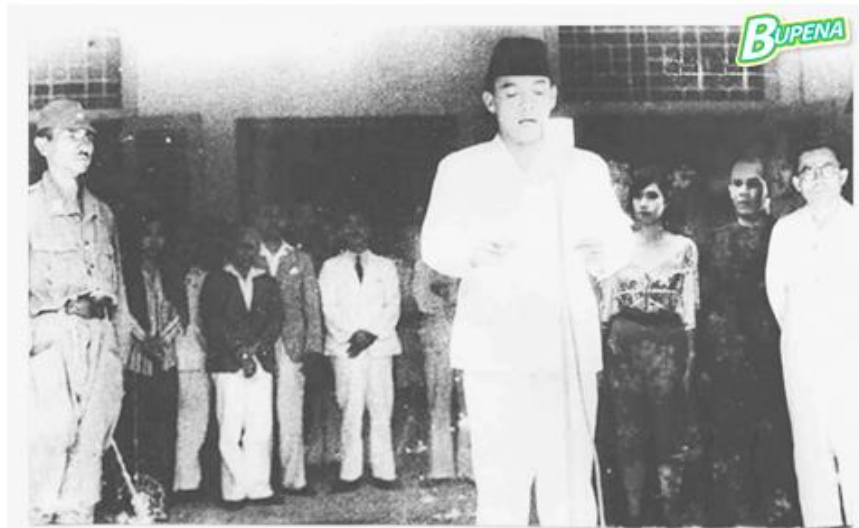
Pembacaan teks Proklamasi oleh Ir. Soekarno