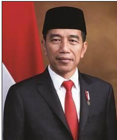
Presiden Republik Indonesia