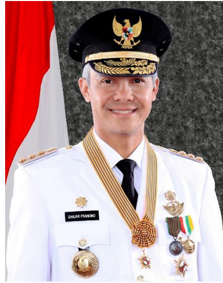
Gubernur Jawa Tengah