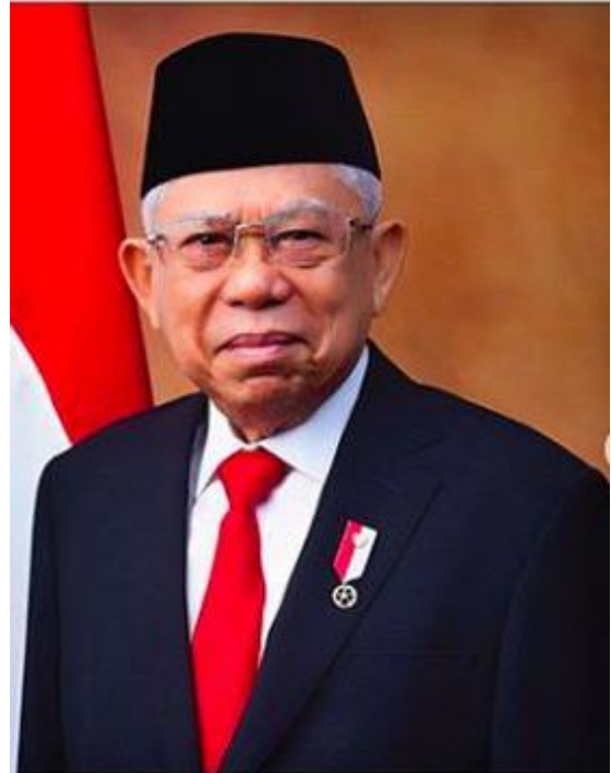
K.H. MA'RUF AMIN Wakil Presiden Republik Indonesia