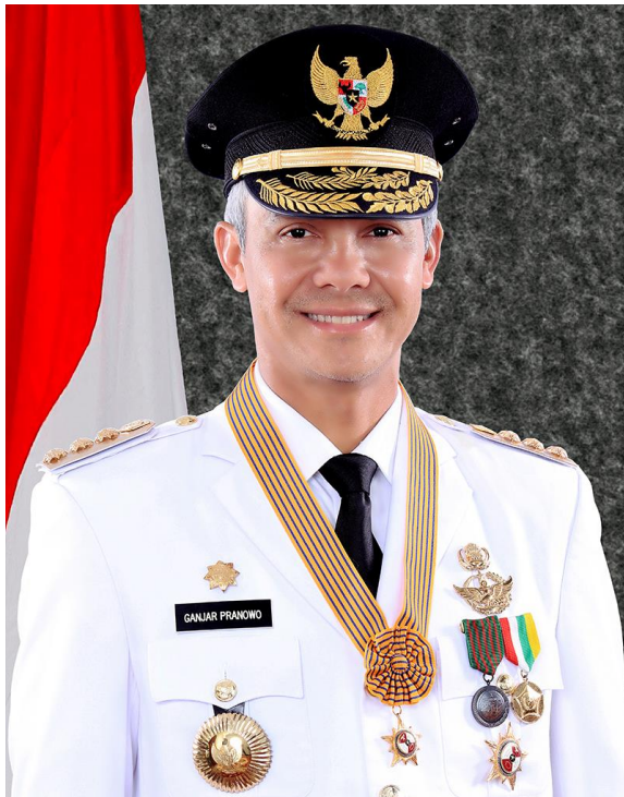
H. GANJAR PRANOWO, S.H, M.IP Gubernur Jawa Tengah