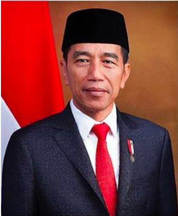
Ir. H. JOKO WIDODO Presiden Republik Indonesia