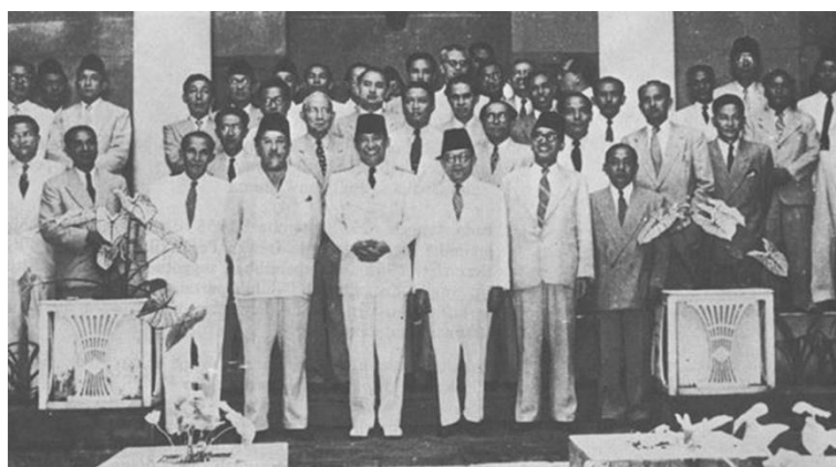
Kabinet Ali Sastroamidjojo I

Keberhasilan Kabinet ini adalah menyiapkan Pemilu dan pelaksanaan Konferensi Asia Afrika pada tanggal 18-24 April 1955. Penyebab jatuhnya kabinet ini adalah adanya persoalan dalam TNI-AD, yakni penolakan pimpinan AD baru yang diangkat oleh Menteri Pertahanan tanpa menghiraukan norma-norma yang berlaku dalam lingkungan TNI-AD.