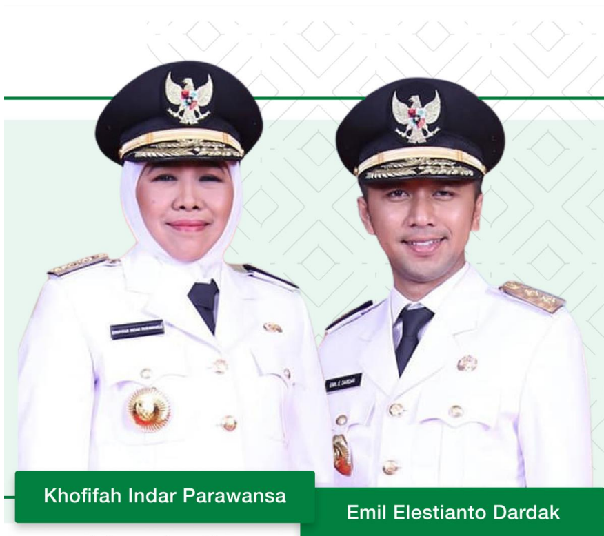
Khofifah Indar Parawansa