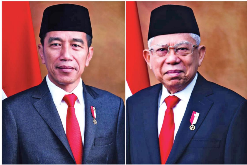
Ir. H. Joko Widodo Presiden Republik Indonesia