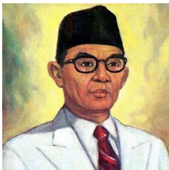
Ki Hajar Dewantara