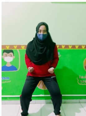
Gambar sikap kuda-kuda,