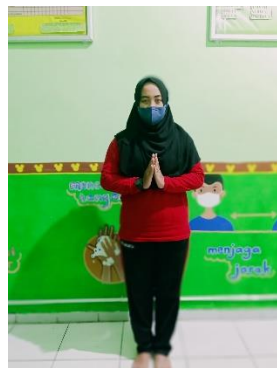
Sikap pasang, sikap tegak,

Informasi pola gerak langkah dalam pencak silat.;