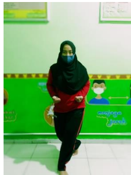
Pola Gerak Langkah Silang Depan dan Silang Belakang