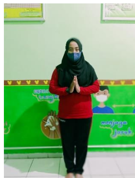
Sikap pasang, sikap tegak,