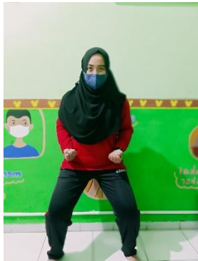
Gambar sikap kuda-kuda,