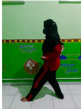
Pola Gerak Langkah Belakang