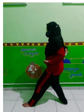
Pola Gerak Langkah Belakang