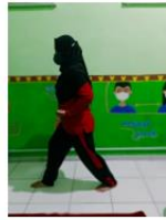
Pola Gerak Langkah Depan