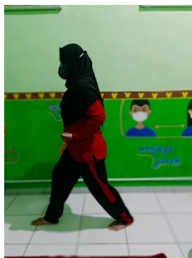
Pola Gerak Langkah Depan