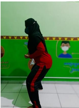
Sikap kuda – kuda tengah