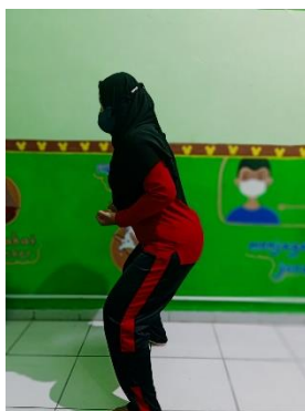
Sikap kuda – kuda tengah