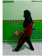
Pola Gerak Langkah Belakang

Informasi mengenai sikap kuda-kuda, sikap pasang, sikap tegak dalam pencak silat