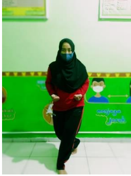
Pola Gerak Langkah Silang Depan dan Silang Belakang