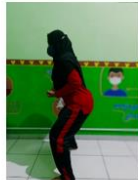
Sikap kuda – kuda tengah