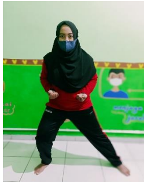
Pola Gerak Langkah Samping