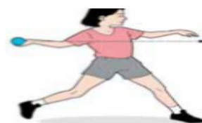
Gambar 1.2 Lemparan datar