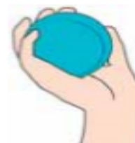
Gambar 1.1 Cara memegang bol.