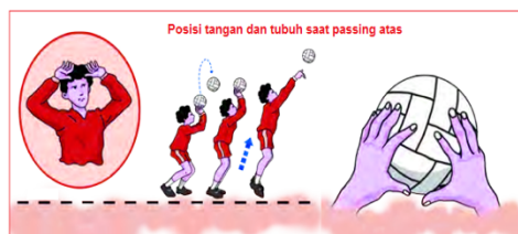
Gambar 2. Pasing Atas