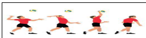
Gambar 4. Servis Atas