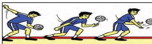
Gambar 3. Servis Bawah