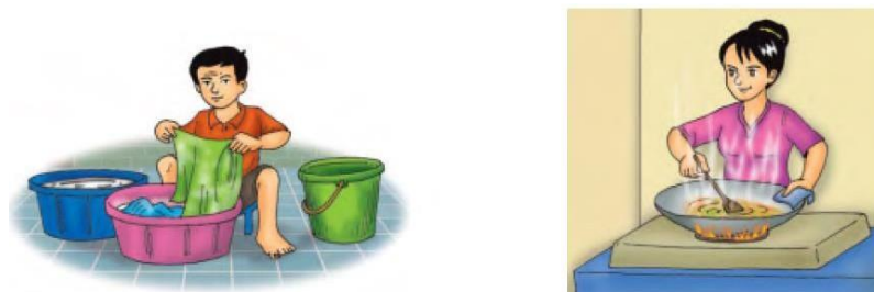
Gambar 11.1 Beberapa kegunaan air dalam kehidupan sehari-hari

Sebagian tubuh kita terdiri dari air. Apabila tidak minum air selain kehausan, tubuh kitapun menjadi lemas. Banyak sekali kegunaan air dalam kehidupan. Oleh karena itu, kita perlu menggunakan air dengan sebaik-baiknya. Air yang kita gunakan dalam kehidupan sehari-hari berasal dari suatu proses yang cukup panjang yang disebut daur air.