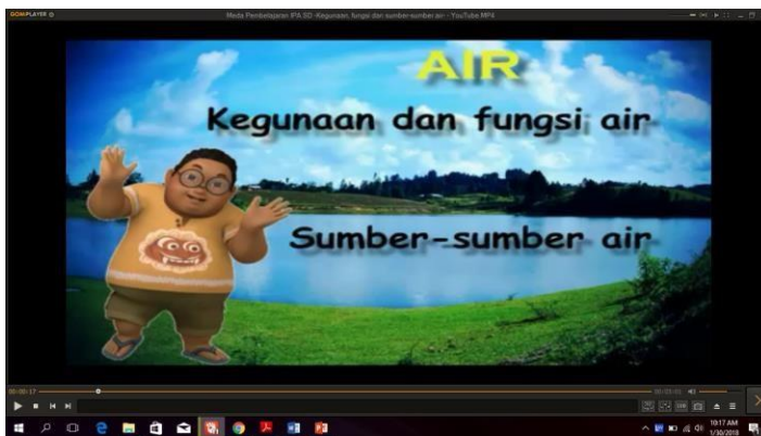
Kegunaan Air bagi Kehidupan