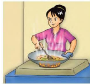
Gambar 11.1 Beberapa kegunaan air dalam kehidupan sehari-hari