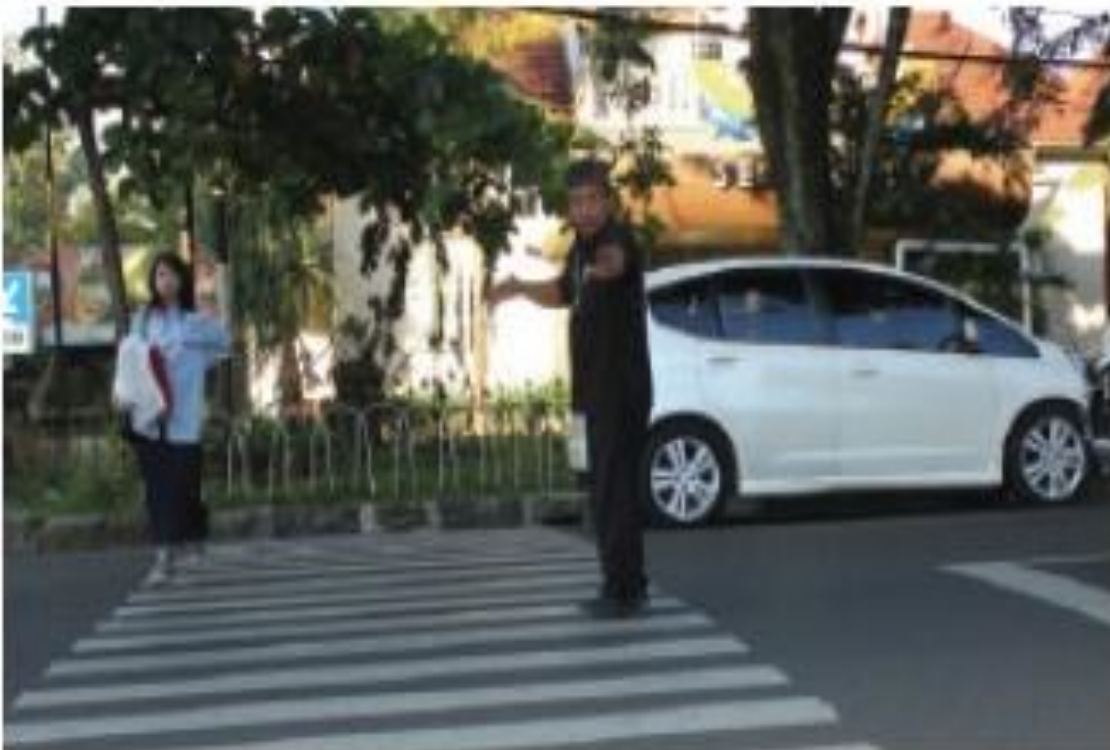
Gambar 4.2 Kemacetan Lalu Lintas