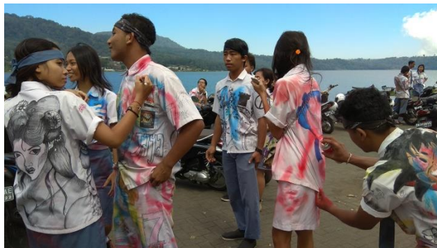
Gambar 1. Anak SMA Corat-corek Seragam saat kelulusan