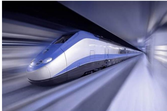
Gambar 1. Kereta Cepat