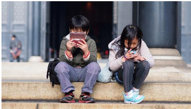
Gambar 1. Anak yang asik bermain HP