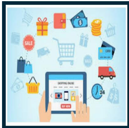
Gambar 1. Belanja Online