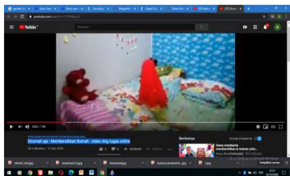
Video anak membersihkan kamar ( https://www.youtube.com/watch?v=L1KTrNxq_5I )