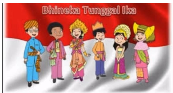
ragaman Karakteristik Individu di Sekolah (Kelas 2 SD) Benda : 22 Des 2020

Lalu bagaimanakah sikapmu terhadap semua keberagaman yang dimiliki temanmu? Ya benar! Sikap kita adalah saling menghargai dan menghormati, bersikap rukun dan saling membantu, tidak mengejek dan memandang keberagaman sebagai Anugrah Tuhan. Itu semua sesuai dengan semboyan Bangsa Indonesia yaitu Bhineka Tunggal Ika. Apakah Bhineka tunggal Ika itu? Walaupun berbeda-beda tetapi satu jua.