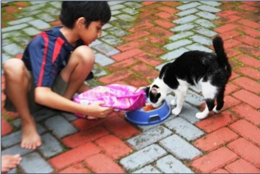
( memberi makan kucing )