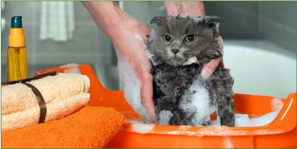
( memandikan kucing )