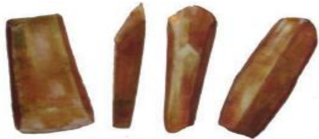
Gambar 33. Alat batu peninggalan zaman Batu Baru