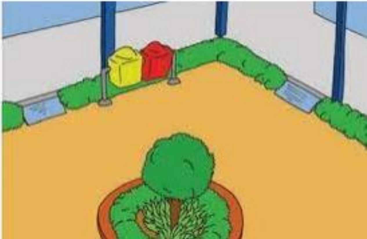
Gambar lingkungan sekolah yang bersih