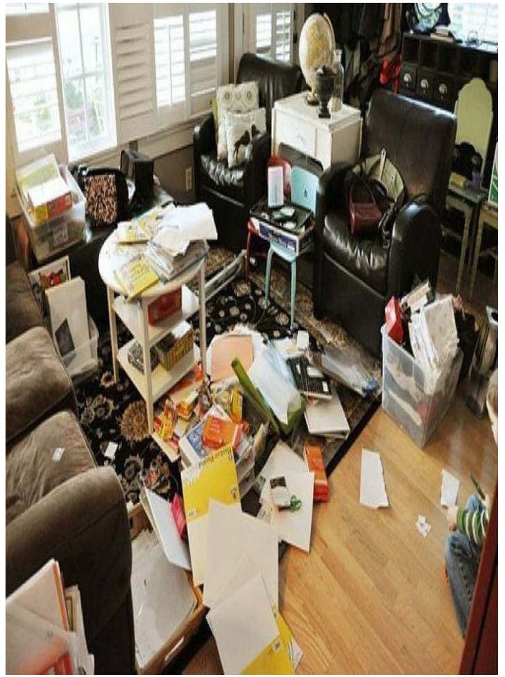
GAMBAR RUMAH YANG TAMPAK KOTOR