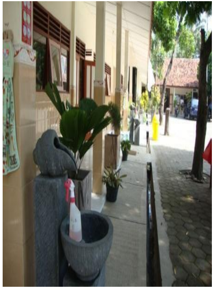
GAMBAR SEKOLAH YANG BERSIH