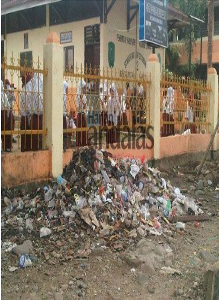
GAMBAR SEKOLAH YANG TAMPAK KOTOR