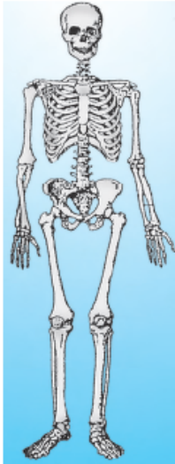
Gambar 1 Rangka Manusia