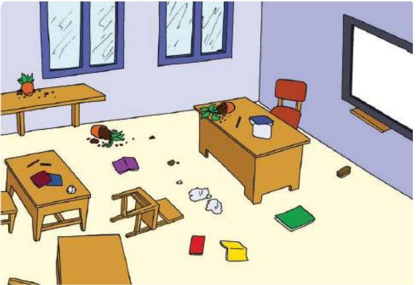
GAMBAR RUANG TIDAK BERSIH