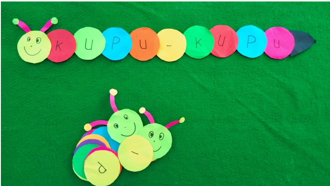
Karya seni membuat bentuk ulat dengan media tisu