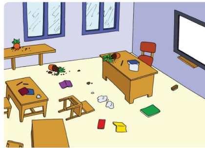
LINGKUNGAN TIDAK BERSIH

Kartu kata yang berisi ciri-ciri lingkungan sekolah yang bersih dan kotor