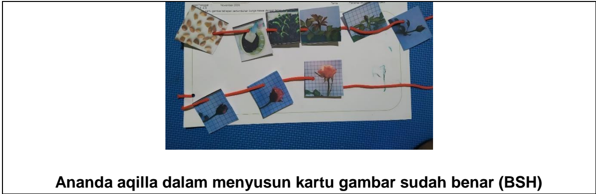
Ananda aqilla dalam menyusun kartu gambar sudah benar (BSH)