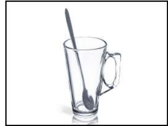
gelas dan sendok