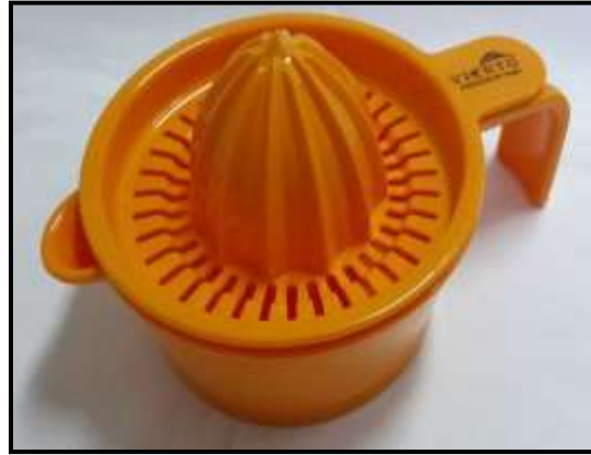
alat pemeras jeruk