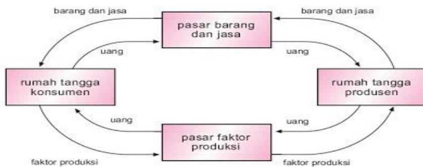
Gambar 2. Arus perputaran faktor produksi, barang dan jasa, serta uang antara rumah tangga konsumsi dengan perusahaan.