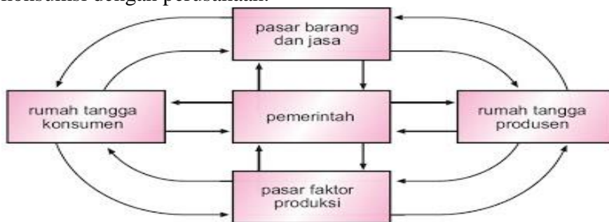
Gambar 3. Arus perputaran faktor produksi, barang dan jasa, serta uang antara rumah tangga, perusahaan, dan pemerintah.