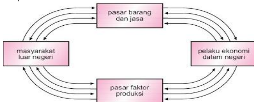
Arus perputaran faktor produksi, barang dan jasa, serta uang antara masyarakat luar negeri dengan pelaku kegiatan ekonomi dalam negeri.