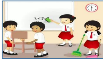
Gb. 3. Piket Kelas