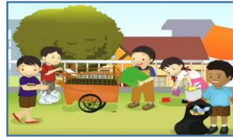
Gb. 4. Kerja Bakti