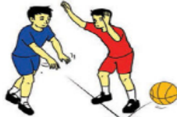
Gambar 1.32. Mengoper bola dengan pantulan