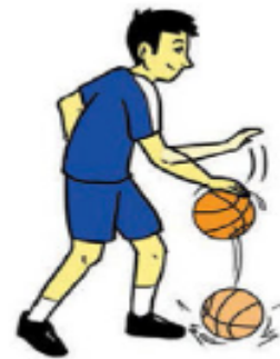
Gambar 1.35. Menggiring bola