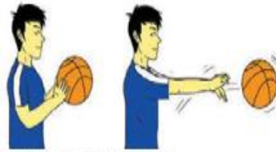
Gambar 1.31. Mengoper bola setinggi dada