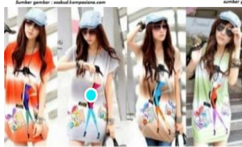
Masuknya mode-mode pakaian luar negeri