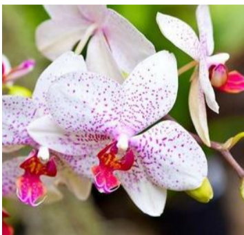
Gambar Diskusi Muatan IPA