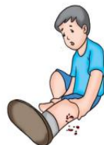
Gambar 9.10 Luka gigitan oleh binatang

Bahaslah bersama temanmu terkait bentuk luka gigitan. Jelaskan hasil pembahasan kepada teman dan guru secara santun.