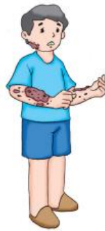
Gambar 9.11 Luka bakar pada lengan

Luka bakar adalah kerusakan pada kulit yang disebabkan panas, listrik, zat kimia, gesekan, atau radiasi. Luka bakar mengakibatkan gejala seperti kulit melepuh, kulit mengelupas, kulit hangus, dan pembengkakan. Keadaan ini biasanya menimbulkan gelembung cairan di bawah kulit. Luka bakar juga dapat melukai bagian tubuh lain, seperti otot, pembuluh darah, saraf, paru-paru, dan mata. Bagaimana bentuk luka bakar? Amatilah bentuk luka bakar seperti Gambar 9.11. Jelaskan luka bakar seperti gambar tersebut. Bandingkan hasil deskripsimu dan hasil deskripsi temanmu. Jelaskan hasil perbandinganmu kepada teman dan guru secara santun.