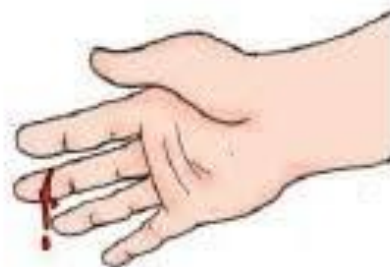
Gambar 9.6 Luka iris karena benda tajam

Amatilah luka iris seperti Gambar 9.6. Apakah luka ini termasuk cedera ringan? Bahaslah bersama temanmu, kemudian jelaskan hasil pembahasan kepada teman dan guru.