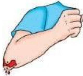
Gambar 9.8 Luka lecet pada siku

Luka lecet terjadi akibat permukaan kulit tergesek permukaan kasar. Luka lecet umumnya lebih sakit atau perih daripada luka iris. Luka lecet dapat menyakitkan karena menjangkau banyak ujung saraf di bawah kulit. Amatilah Gambar 9.8.