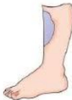
Gambar 9.7 Luka memar karena benturan dengan benda keras

Amatilah luka memar seperti Gambar 9.7. Bagaimana luka memar dapat terjadi? Apakah luka ini mengganggu gerak tubuh manusia? Bahaslah bersama temanmu, kemudian jelaskan kepada guru secara santun.