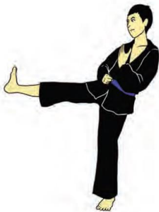
Tendangan Lurus Ke Depan