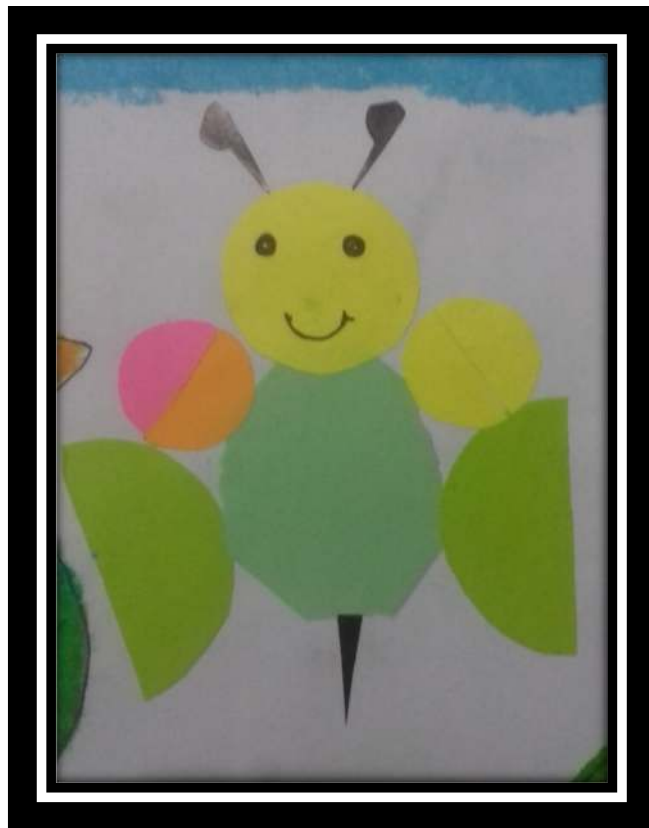
Contoh hasil kegiatan