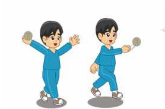
Gambar 1. Melempar bola lurus ke depan