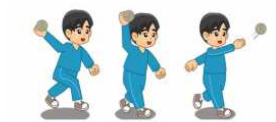
Gambar 3. Melempar bola rendah