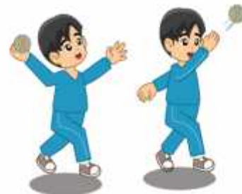
Gambar 2. Melempar bola melambung