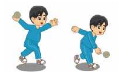
Gambar 4. Melempar bola mengelundung