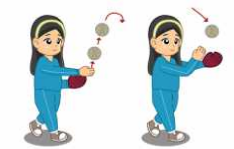
Gambar 5. Menangkap bola dengan cara melempar bola ke atas