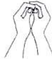
Gambar anak melakukan passing bawah