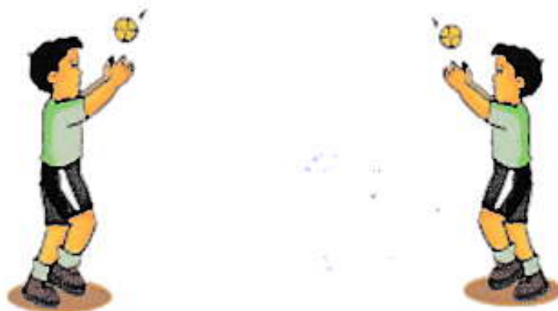
Gambar anak melambungkan bola