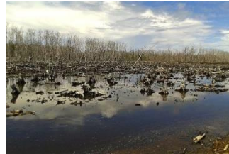
Gambar 2. Kerusakan hutan mangrove

Amatilah gambar 1 dan 2 serta carilah informasi tentang potensi sumber daya hutan mangrove di Indonesia, lalu kerjakan tugas berikut dengan baik!