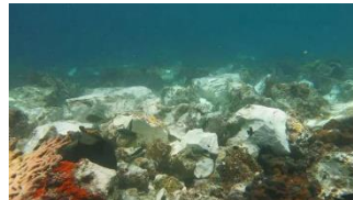
Gambar 2. Pencemaran terumbu karang

Amatilah gambar 1 dan 2 serta carilah informasi tentang potensi sumber daya terumbu karang di Indonesia, lalu kerjakan tugas berikut dengan baik!