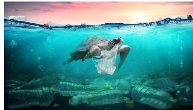
Gambar 2. Pencemaran laut

Amatilah gambar 1 dan 2 serta carilah informasi tentang potensi sumber daya laut di Indonesia, lalu kerjakan tugas berikut dengan baik!