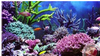
Gambar 1. Terumbu karang