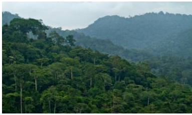
Gambar 1. Hutan