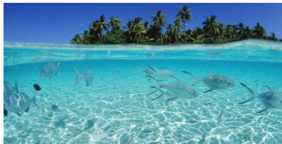
Gambar 1. Laut