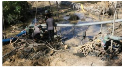
Gambar 2. Pertambangan emas ilegal

Amatilah gambar 1 dan 2 serta carilah informasi tentang potensi sumber daya tambang di Indonesia, lalu kerjakan tugas berikut dengan baik!