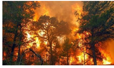
Gambar 2. Kebakaran Hutan

Amatilah gambar 1 dan 2 serta carilah informasi tentang potensi sumber daya hutan lalu kerjakan tugas berikut dengan baik!