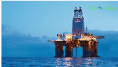
Gambar 1. Pertambangan minyak bumi